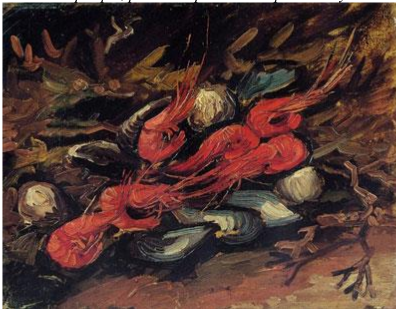
Креветки и мидии. 1886.

«Торопливо входит он к торговцу, продающему "старые железные изделия, картины масляной живописи по дешевым ценам и стрелы дикарей". Несчастный художник, ты отдал частицу своей души, когда писал этот холст, который ты собираешься теперь продать! Маленький натюрморт, розовые креветки на розовой бумаге.