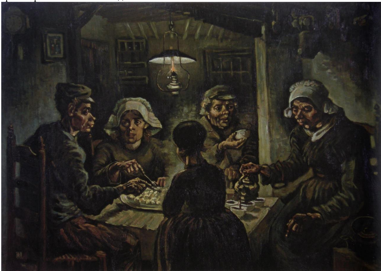
Едоки картофеля. 1885.

В этих голландских «Креветках и мидиях» Ван Гога нет ещё той светозарности, что осенила его на юге Франции. Есть только недовольство пошлостью. Да, пошлостью. В Голландии, славившейся великими натюрмортами еды, к еде стали относиться, как к чему-то, от чего надо скорей избавиться. Спешка. Всемирная спешка. А мидии с креветками можно сварить за пять минут и съесть. Этот мрак колорита есть отрицание того, что ценили импрессионисты – ценности мгновения. В «Едоках картофеля» этот нюанс ещё сильнее виден. Картофель – чудо-продукт, покончивший с голодом в Западной Европе в принципе. Ну и тьфу на него! Ван Гог головой ещё не знал про себя, что он за аристократизм. Но знало подсознание.